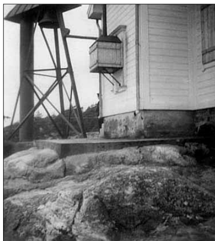
Femörehuvuds gamla fyrr med oljelyktan placerad på gaveln.

Fyrljuset var en oljelykta med fast sken som lyste hela tiden, så den personal som ansvarade för driften var tvingade att se till att det fanns olja för att lysa ca en vecka. Pålitliga personer eller personal fick sköta om dom. Servades en gång i veckan och det var mycket noga att det fungerade. 1889 kom fotogenet och lyktorna fick därmed ett betydligt bättre sken.